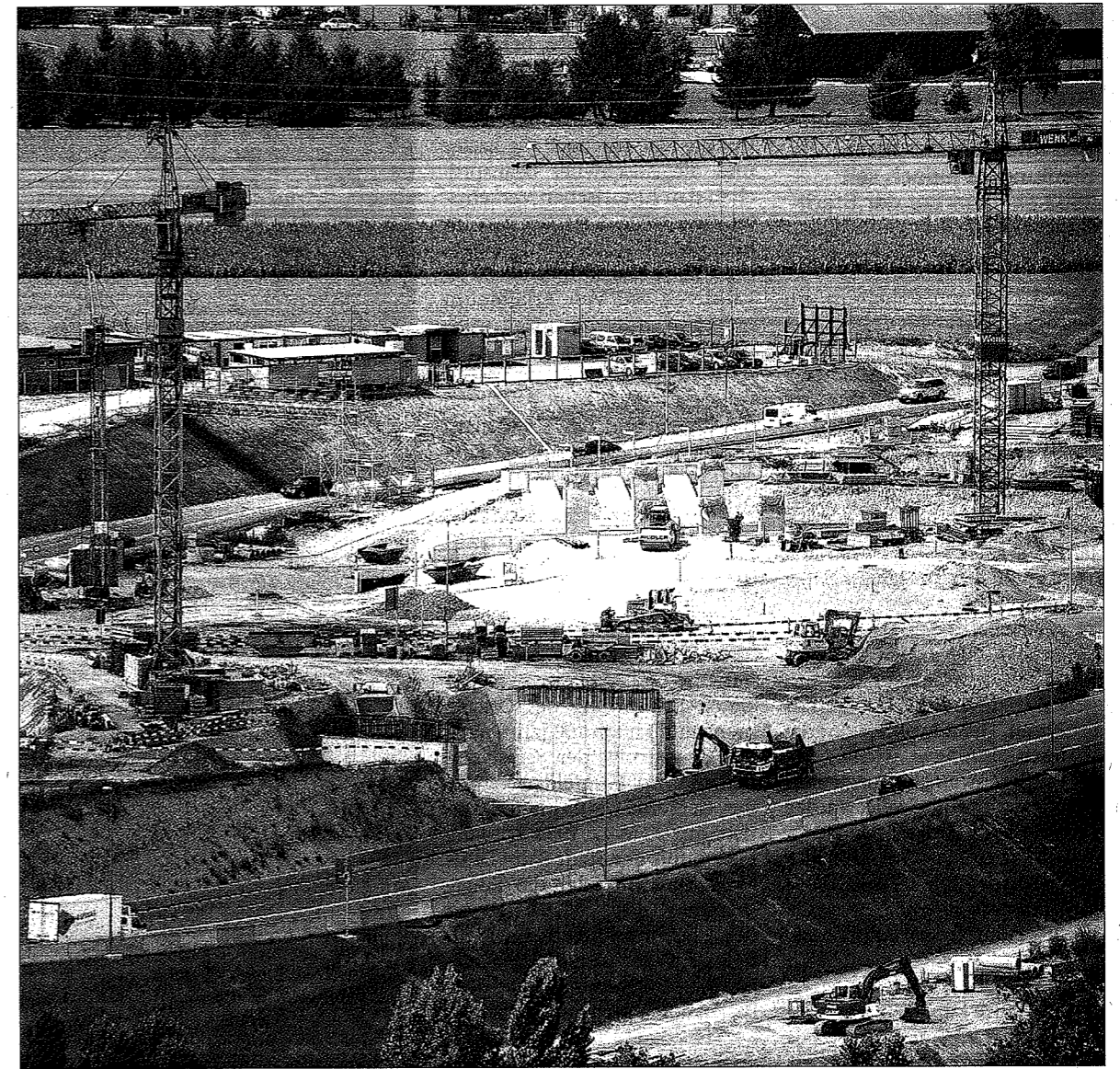
BAUSTELLE 2 Der Hülften-Kreisel wird planmässig fertig. In zwei Wochen ändert sich die Verkehrsführung. KENNETH NARS