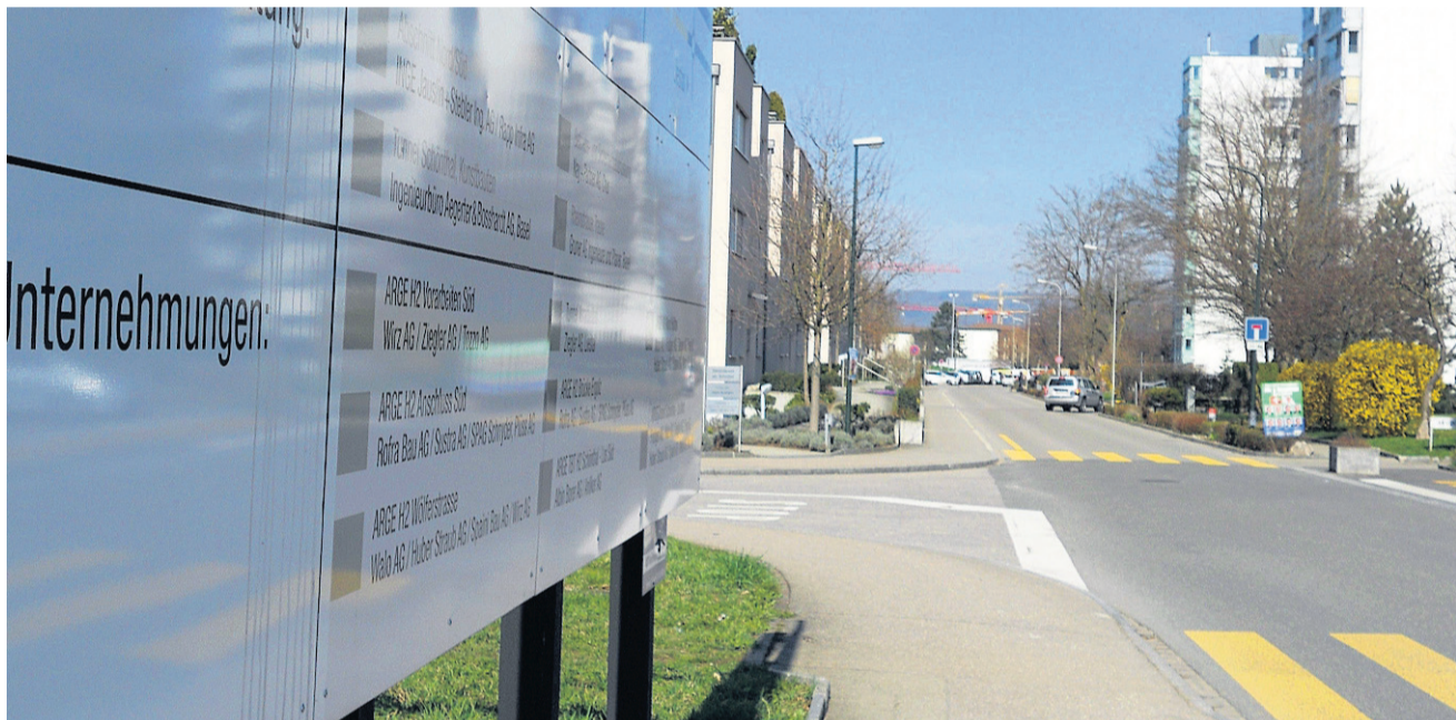
Entlastungsstrasse: Durch die Ergolzstrasse soll ab Mai ein Teil des Rheinstrasse-Verkehrs abfliessen.

Mit 169 Stundenkilometern ist ein 23-jähriger Portugiese in der Nacht auf gestern über die A2 gebrettert. Registriert hat ihn die Polizei um 3.49 Uhr beim Schweizerhalle-Tunnel in Fahrtrichtung Basel. Erlaubt wären hier 100 km/h. Der in der Region wohnhafte Lenker muss mit einer Geldbusse, einem Strafverfahren sowie einem mehrmonatigen Führerausweisentzug rechnen, wie die Baselbieter Polizei mitteilte. (BZ)