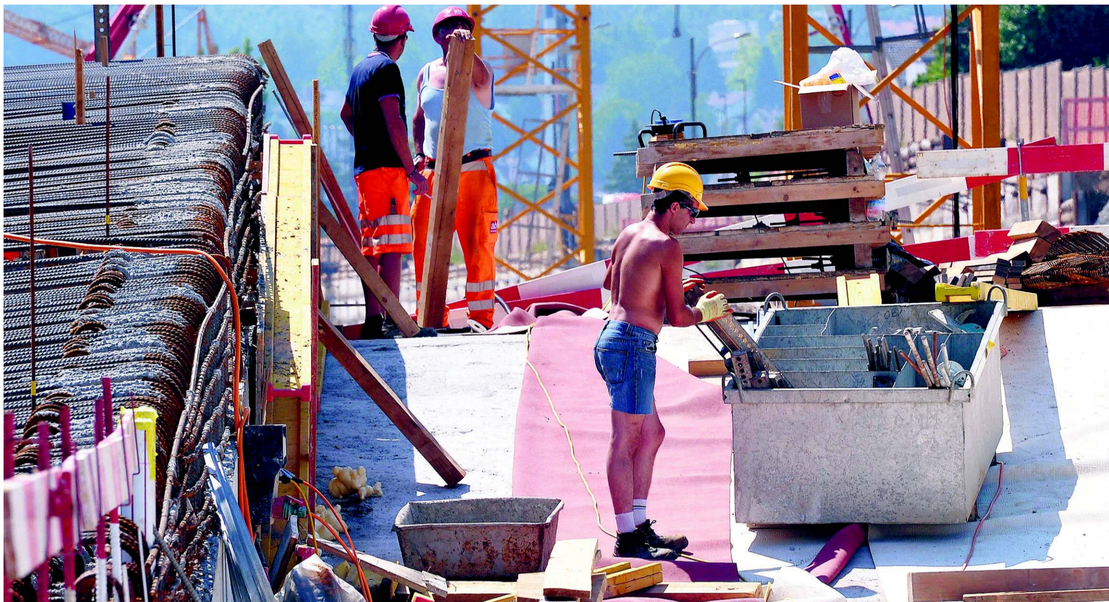
Beim Abschnitt Schönthal kämpfen die Bauarbeiter nicht nur mit schweren Gerätschaften, sondern gestern auch gegen die Hitze.