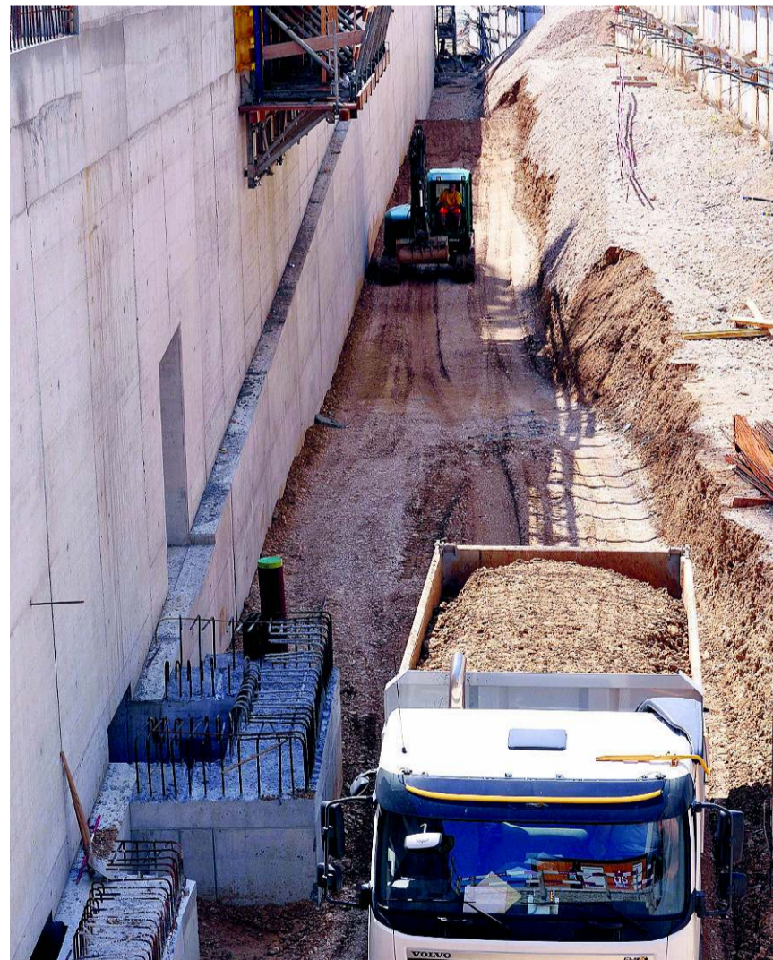
Die Baustelle wird geprägt von tiefen Gräben entlang des Tunnels.

Weitere Bilder der H2-Baustelle unter www.basellandschaftlichezeitung.ch